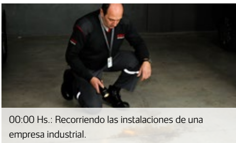
00:00 Hs.: Recorriendo las instalaciones de una empresa industrial.

Antes de salir de Securitas el guardia verifica el correcto funcionamiento del automóvil y que dentro del mismo se encuentren todos los elementos necesarios para el normal desarrollo de la ronda.