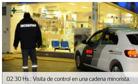
02:30 Hs.: Visita de control en una cadena minorista.

Al guardia le llama la atención un derrame de líquidos que podría representar un riesgo. Luego de corroborar que no existe un peligro inminente, procede a su secado y anotación para luego informar al cliente.