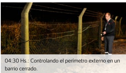
04:30 Hs.: Controlando el perímetro externo en un barrio cerrado.

La inspección del acceso principal e iluminación externa no presenta novedades. El guardia se acerca al local para verificar que las puertas se encuentren bien cerradas.