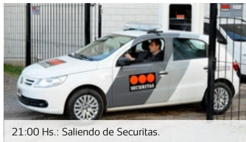
21:00 Hs.: Saliendo de Securitas.

El operador de ronda en reunión con su supervisor recibe la hoja de ruta en donde se detallan todas las locaciones que deberá visitar esa noche durante su ronda nocturna.