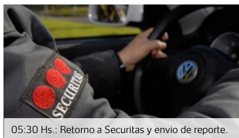
05:30 Hs.: Retorno a Securitas y envío de reporte.

Un agujero en el enrejado perimetral es notado por el guardia de ruta. Se toma nota del hecho y se avisa inmediatamente al personal de seguridad que está en la entrada al barrio.